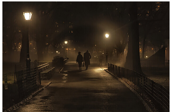
Senza tecnica di ottimizzazione dell'immagine