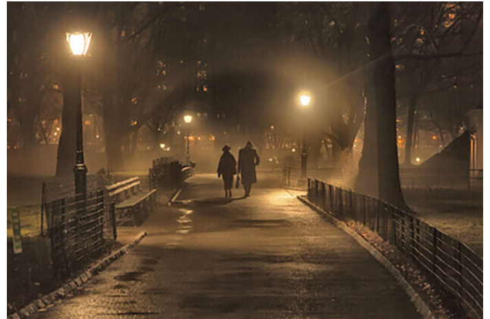
Con tecnica di ottimizzazione dell'immagine

L'elaborazione delle immagini si avvale della teoria di Retinex per correggere il livello di nitidezza in ciascun pixel.